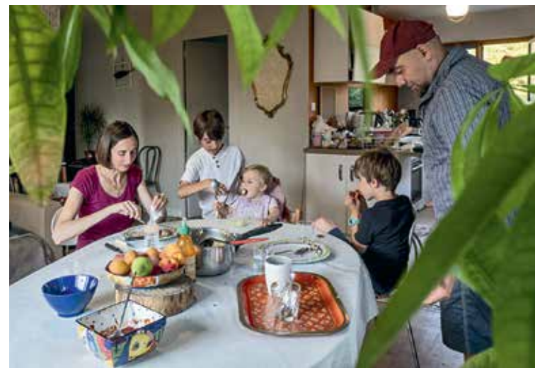
BRUNO ANISELMI/ÉMERGENCE POUR LA VIE